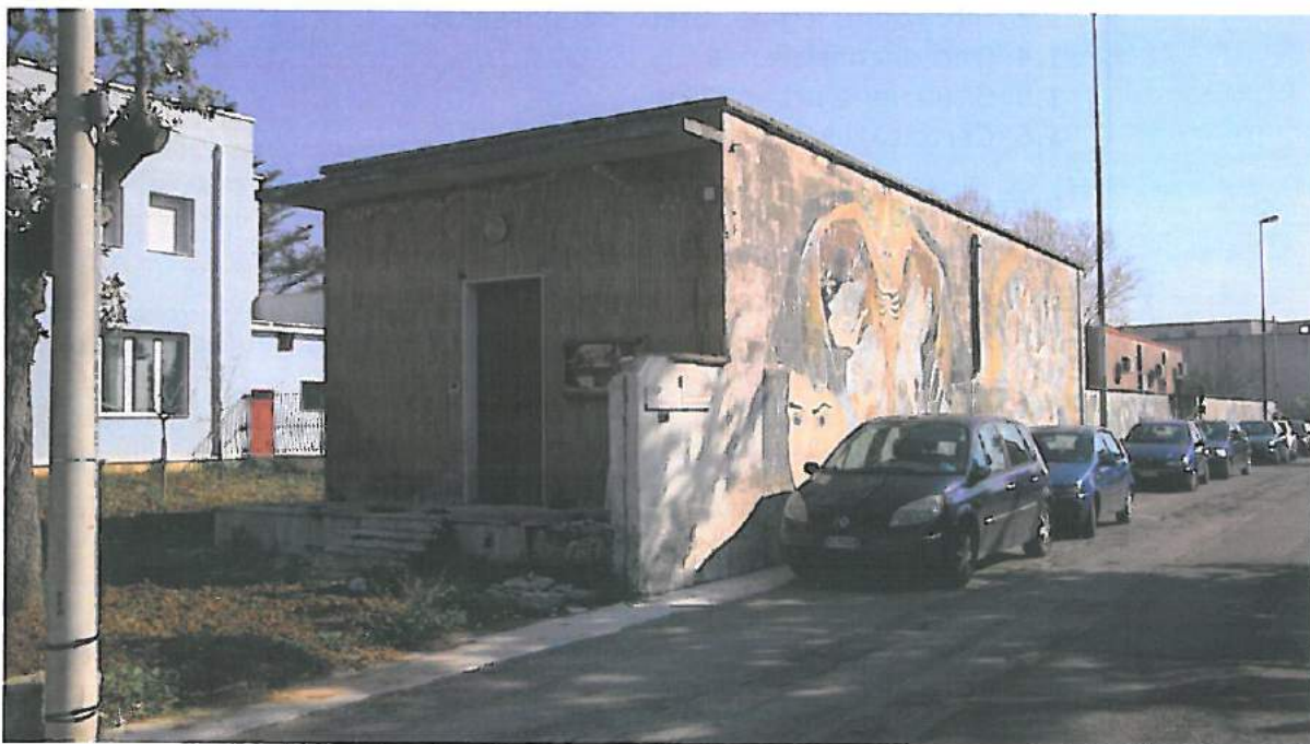
L'ex casa del custode

Viale Gallipoli, 37 - 73100 Lecce tel. 0832307575 - ud lecce@agenziaentrate.it