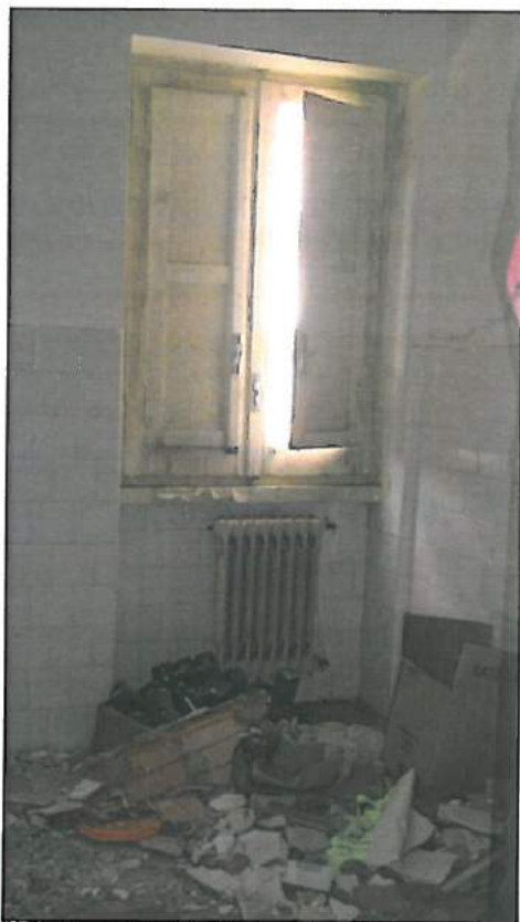
Situazione degli infissi e dei solai