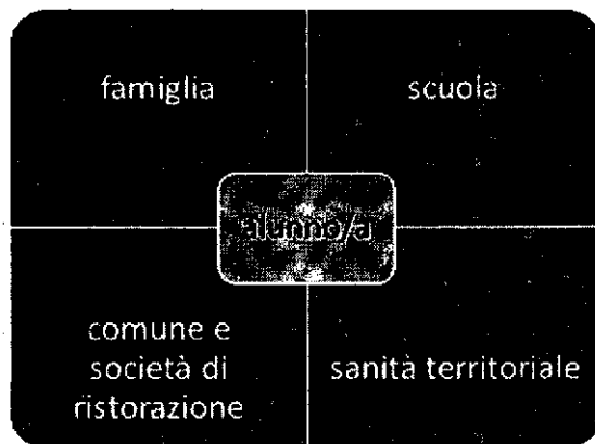
Network in ambiente scolastico